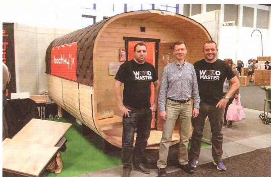
Участие компании ООО «Вуд Экс-порт» в международной выставке «Grüne Woche 2018» (г. Берлин, Германия)

Центр поддержки экспорта Курской области имеет опыт организации коллективных экспозиций на международных российских и зарубежных выставках (не менее 3 участников от разных предприятий) в составе единой делегации от Курской области. В составе коллективной экспозиции могут принять участие представители субъектов малого и средне-