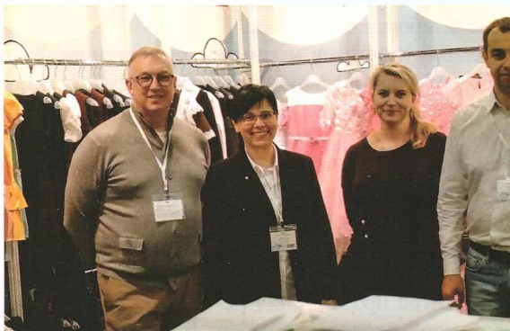
Участие в Международной выставке «СJF-Детская мода. Осень 2018» (г. Москва, РФ)

ЦПЭ в 2018 году организовал участие субъектов МСП Курской области в различных международно – ярмарочных мероприятиях: бизнес-делегация Курской области в XII Петербургском Партнериате малого и среднего бизнеса «Санкт-Петербург –