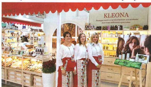
Участие компании ООО «Клеона» в международной выставке Интериарм 2018 (г. Москва, РФ)

В случае необходимости сотрудники Центра подберут необходимую выставку по запросу обратившегося предприятия.