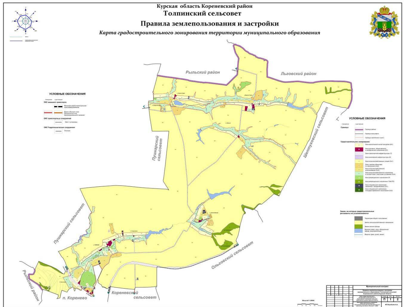
Рис.1. Схема градостроительного зонирования территории муниципального образования «Толпинский сельсовет» Кореневского района Курской области